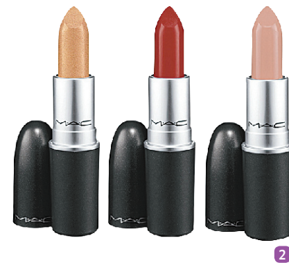
(1) Loja M.A.C Cosmetics (2) Batons da coleção Ruffian